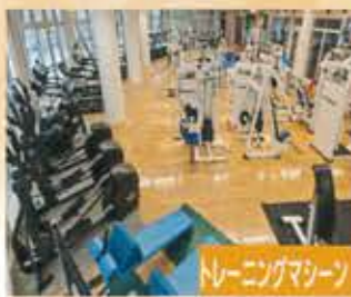
トレーニングマシン