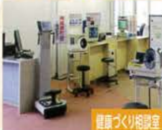
健康づくり相談室