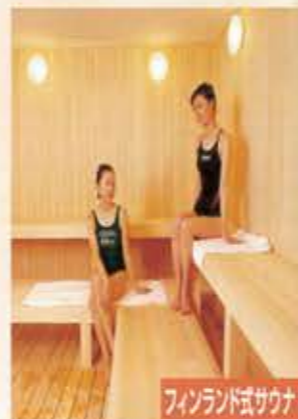
フィンランド式サウナ