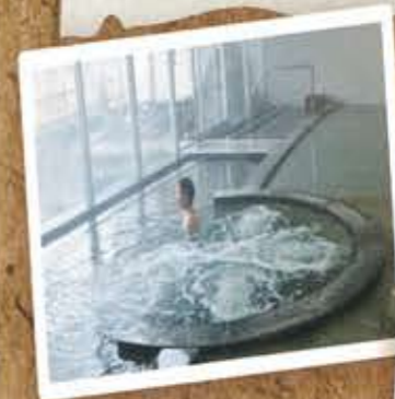
陽だまりの湯 (大浴場・サウナ・露天風呂)

塩分と鉄分を多く含む2種類の源泉を引いており、2週間ごとに男女の浴室が入れ替わります。大浴場や露天風呂でゆったりと温泉につかり、汗と疲れを洗い流せます。