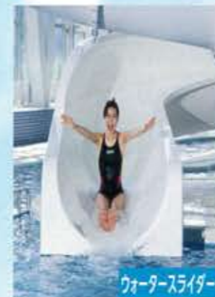
ウォータースライダー

水中での体重は陸上のおよそ10分の1。足腰への負担も少なくなるので、無理のない体づくりにも最適です。スリル満点のウォータースライダー、流水プールは子供たちに人気のスポット。ご家族で楽しむことができます。