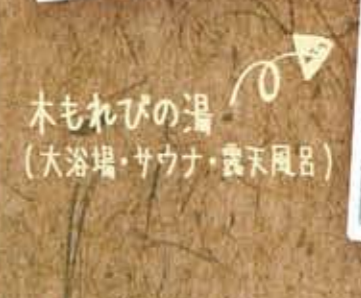
木もれびの湯 (大浴場・サウナ・露天風呂)